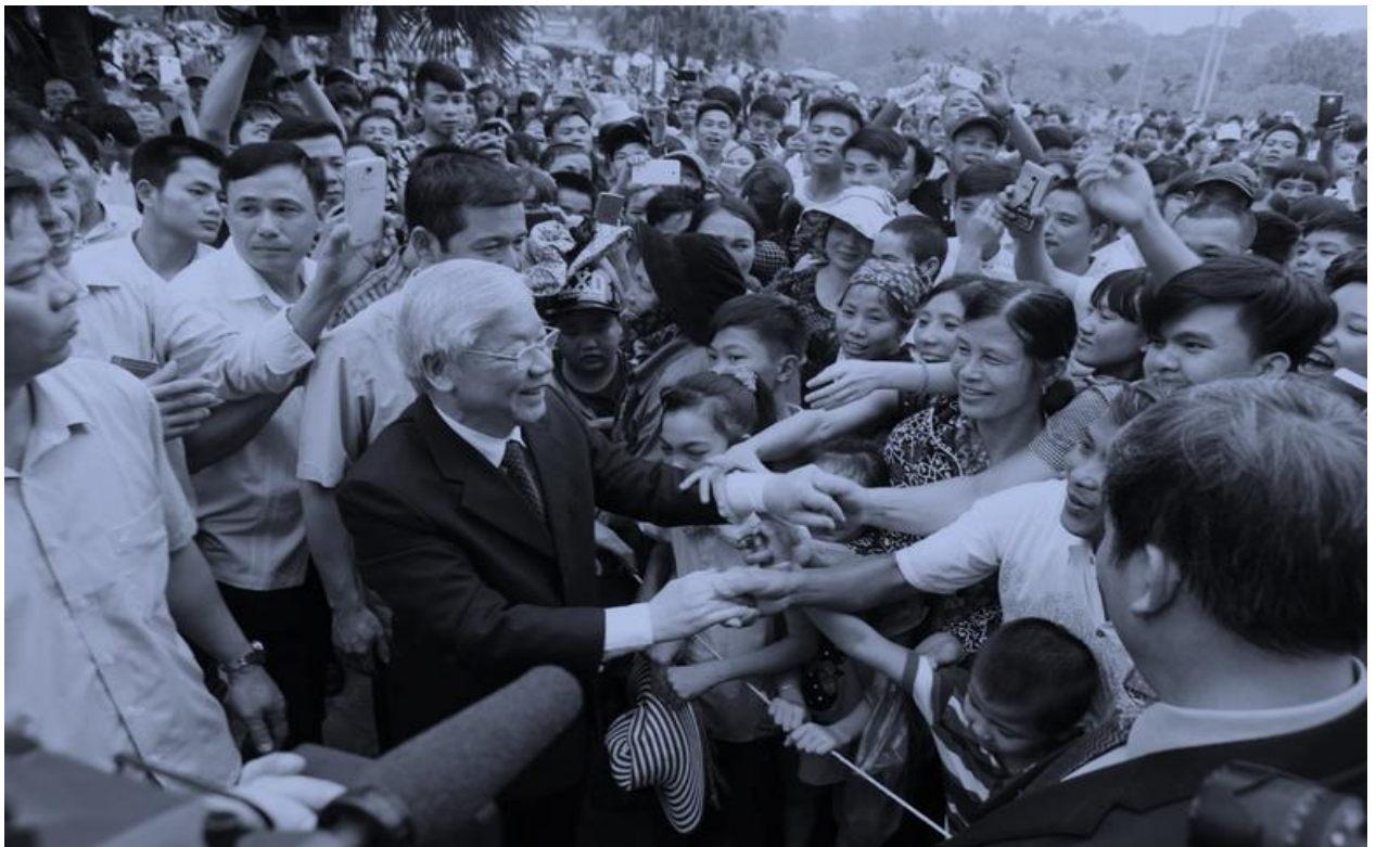
Tổng Bí thư Nguyễn Phú Trọng trong một chuyến công tác cơ sở.

Lúc sinh thời, nguyên Tổng Bí thư Lê Khả Phiêu nhận xét: "Anh Trọng là nhà lý luận sắc bén của Đảng ta. Anh là người cộng sản chân chính, chí tình, chí nghĩa. Tính cách thì nhân hậu, nhưng quyết liệt, không khoan nhượng trong công cuộc chỉnh đốn Đảng để Đảng ta ngày càng trong sạch hơn, xứng đáng là "công bộc, là đầy tớ trung thành của nhân dân" như Hồ Chủ tịch từng khẳng định".