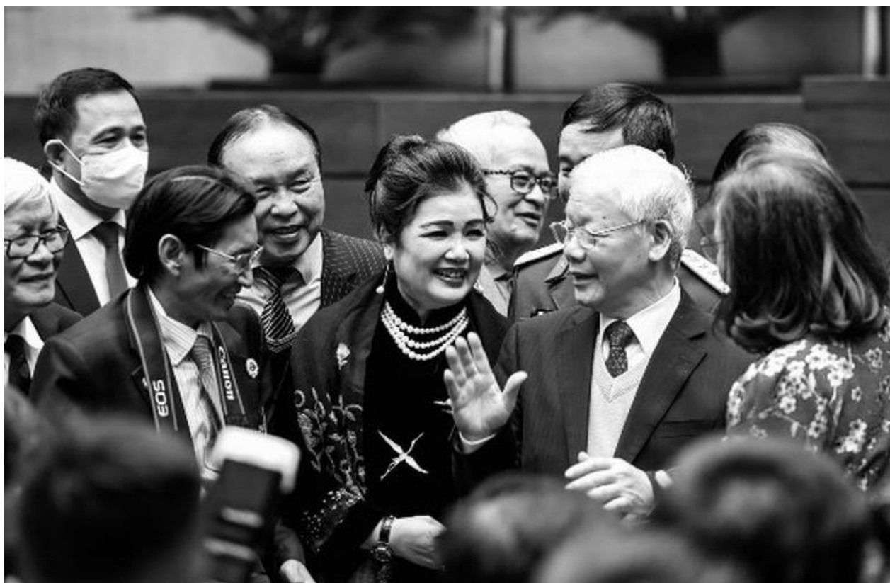
Tổng Bí thư Nguyễn Phú Trọng trò chuyện với các đại biểu tham dự Hội nghị văn hóa toàn quốc tại Nhà Quốc hội, ngày 24/11/2021.

lao động, sáng tạo. Chú ý nghiên cứu những vấn đề mới về lý luận của thế giới; các vấn đề mới do thực tiễn đặt ra; kinh nghiệm của các nước tiên tiến; của cuộc cách mạng về khoa học công nghệ,... Từng bước bổ sung, hoàn thiện lý luận, xây dựng một hệ thống lý luận của cách mạng Việt Nam trong giai đoạn mới: Xây dựng và bảo vệ đất nước, mở cửa hội nhập, là bạn, là đối tác tin cậy, có trách nhiệm của các nước, có vị thế quan trọng trong khu vực và trên thế giới.